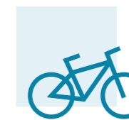
PARKING DE BICICLETAS