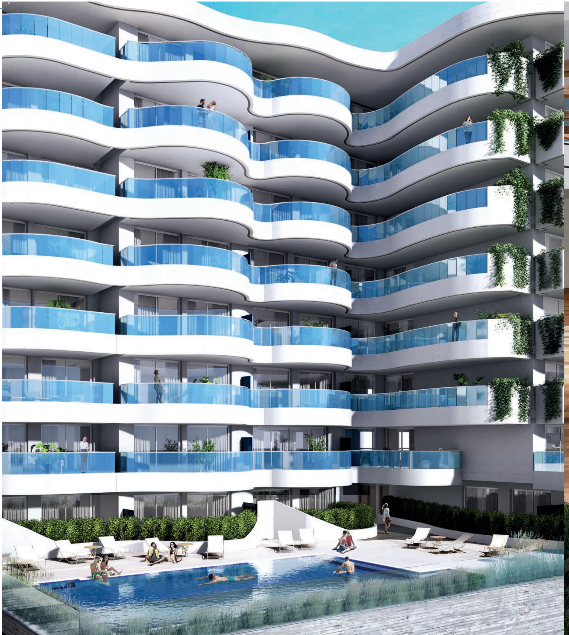
PISCINA EXTERIOR PARA ADULTOS