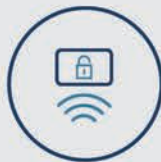
Contactless accesos zonas comunes