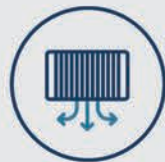
Filtrado aire interior